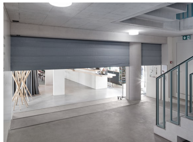
Jugendherberge Marzili in Bern: Abtrennung vertikaler Fluchtweg vom Empfangsbereich.